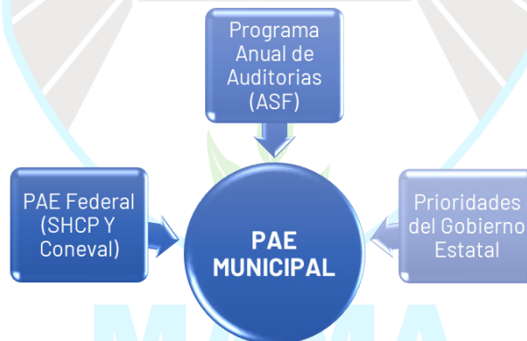
Ilustración 4. Fuentes de información para la integración del Programa Anual de Evaluación

Para determinar las intervenciones públicas que serán sujetas a evaluación se utilizan diversas fuentes de información; en primera instancia el Programa Anual de Evaluación de la Federación, ya que en él se establecen criterios de observancia estatal, así como las evaluaciones que se realizarán por las dependencias federales y que tienen un impacto en Yucatán; de igual forma se considera el Programa Anual de Auditorías de la Auditoría Superior de la Federación (ASF), ya que como parte de las auditorías (principalmente las de desempeño) se revisa que los recursos del gasto federalizado hayan sido sujetos a un proceso de evaluación. Por último, se consideran las prioridades de gobierno, es decir, se identifican intervenciones públicas que requieren ser evaluadas con el fin de mejorar su diseño, gestión y desempeño para lograr el logro de los objetivos de los instrumentos de planeación.